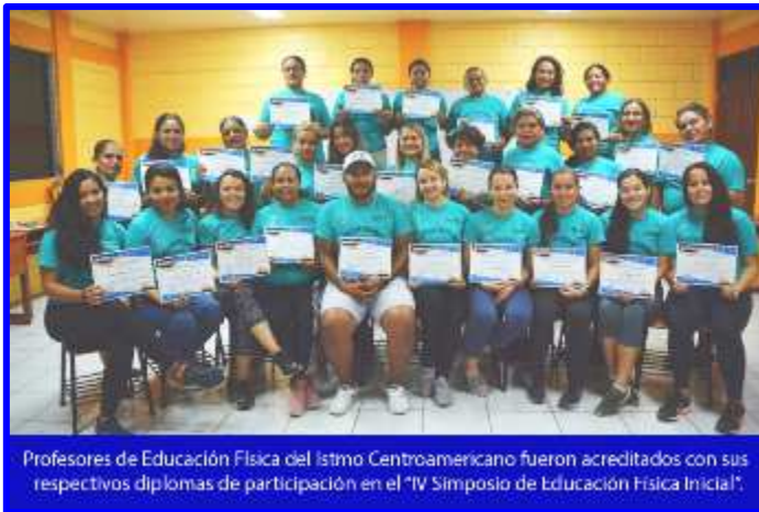
Profesores de Educación Física del Istmo Centroamericano fueron acreditados con sus respectivos diplomas de participación en el "IV Simposio de Educación Física Inicial".

Del 8 al 13 de Diciembre la Dirección de Educación Física del Instituto Nicaragüense de Deportes (IND), realizó el "IV Simposio Centroamericano de Educación Física en Educación Inicial" que tuvo la participación de 24 profesoras de Educación Física de los países de El Salvador, Honduras, Costa Rica y Nicaragua. Entre las actividades realizadas de acuerdo a la agenda de trabajo se