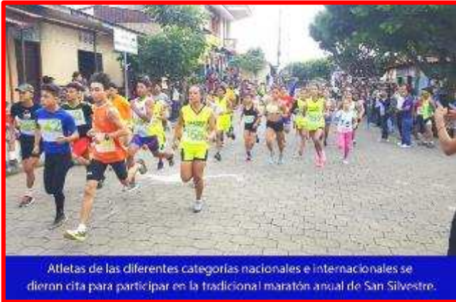
Atletas de las diferentes categorías nacionales e internacionales se dieron cita para participar en la tradicional maratón anual de San Silvestre.

La Federación Nicaragüense de Atletismo, El Movimiento Alexis Arguello, Instituto Nicaragüense de Deportes, Policía Nacional y la municipalidad de Catarina, realizaron el lunes 30 de diciembre, la XLIII edición del Maratón San Silvestre , en donde se dieron cita atletas de 21 municipios del país, además de atletas de España y Costa Rica totalizando 318 atletas (131 mujeres y 187 hombres).