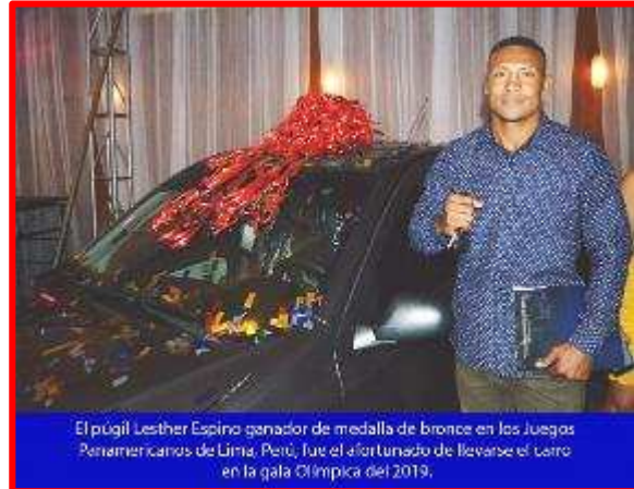
El pugil Lesther Espino ganador de medalla de bronce en los Juegos Panamericanos de Lima, Perú, fue el afortunado de llevarse el carro en la gala Olímpica del 2019.

El ranking de los mejores atletas para este 2019 quedo de la siguiente manera, en primer lugar Lesther Espino de Boxeo, en la segunda posición el Voleibolista Rubén Mora, en el tercer lugar se encuentra Dalila Rugama de Atletismo, seguido de Alejandra