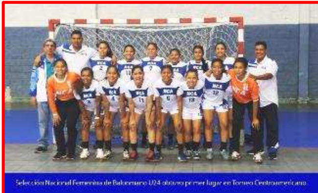
Selección Nacional Femenina de Balonmano U24 obtuvo primer lugar en Torneo Centroamericano.

Del 8 al 14 de Diciembre la selección nacional femenina de balonmano que representó a Nicaragua en el Campeonato Centroamericano Femenil U24 , efectuado en Tegucigalpa, Honduras dejó muy en alto a su país ganando el primer lugar luego que derrotara por la mínima al equipo representativo de Costa Rica con marcador final de 24 x 23.